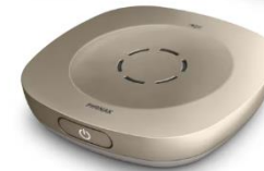
Phonak Roger On™