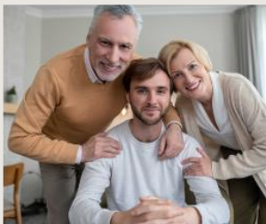
Leválás a szülőkről