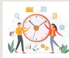
Hogyan urald az időt?