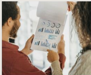
Munkaerőpiaci preferenciák 2023