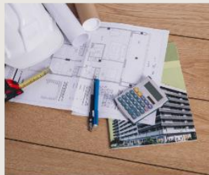
Hogyan készül a bértárgyalásra a gyártó szektorban?