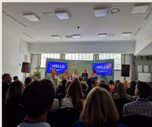
Mit tanulhatunk a légikatasztrófákból az üzleti világban?