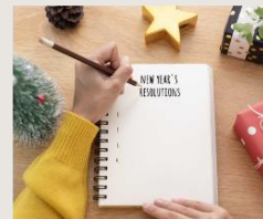
Év eleji lendület és újévi fogadalmaink