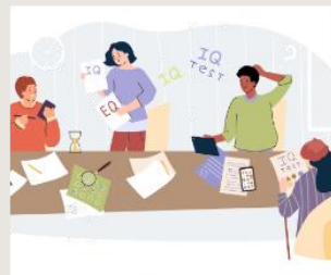
Többszörös intelligencia - Mindenki tehetséges valamilyen