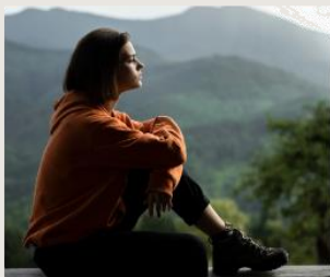
Hogyan küzdj meg a magányosság érzésével?