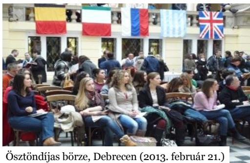
Ösztöndíjas börze, Debrecen (2013. február 21.)