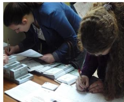
Ösztöndíjas börze Szegeden (2013. febr. 19.)