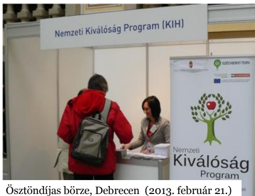
Ösztöndíjas börze, Debrecen (2013. február 21.)

Projektünkkel nemcsak papíron, vagy az interneten találkozhattak az érdeklődők, hanem számos rendezvényen is.