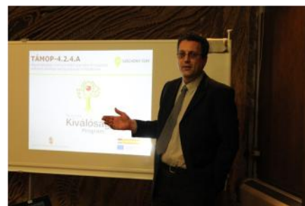
Állásbörze Egerben (2013. április 16.)

Regisztráljon informatikai rendszerünkbe!