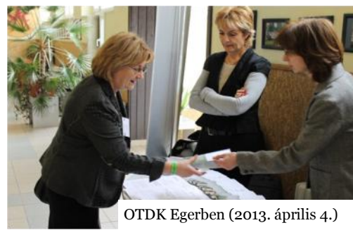
OTDK Egerben (2013. április 4.)